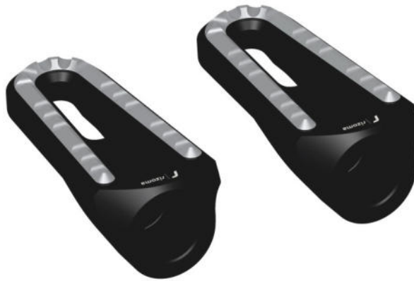
Austauschraste, Ausführung PE642