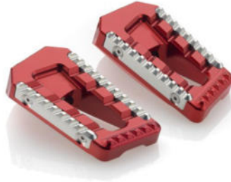
Austauschraste, Ausführung PE622