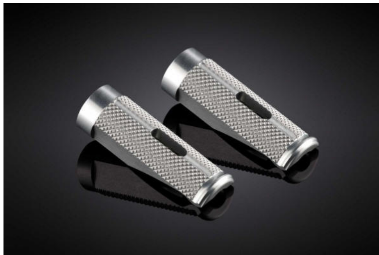
Austauschraste, Ausführung PE614