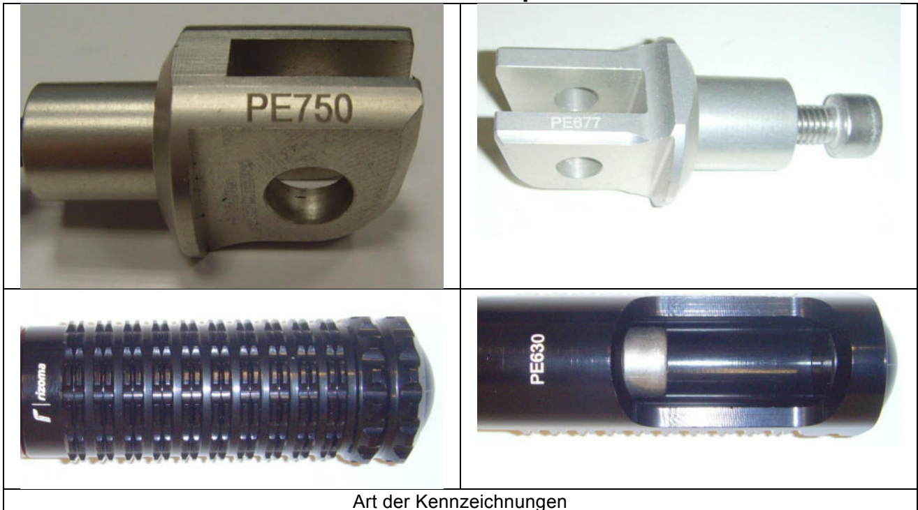
Art der Kennzeichnungen