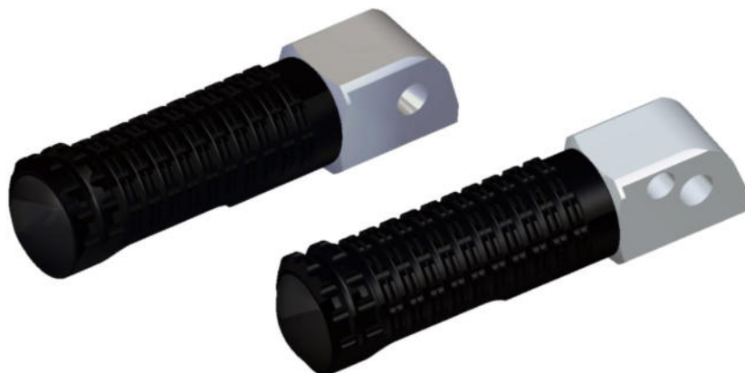
Austauschraste, Ausführung PE127