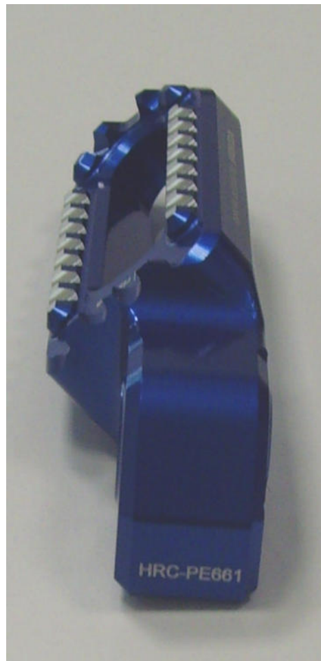
Austauschraste, Ausführung HRC PE661