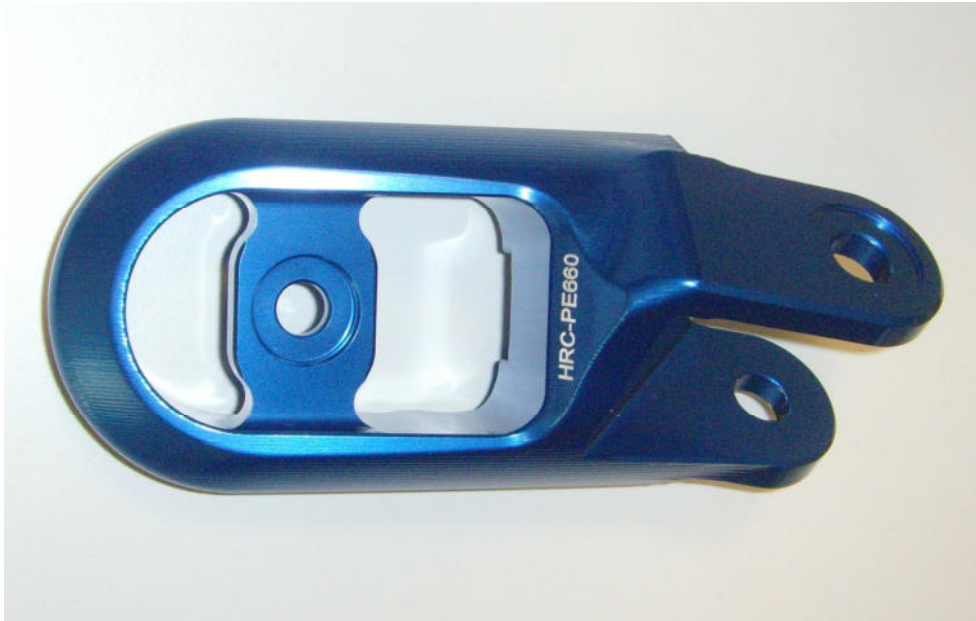
Austauschraste, Ausführung HRC PE660