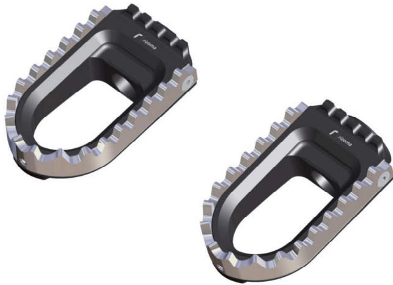
Austauschraste, Ausführung PE640