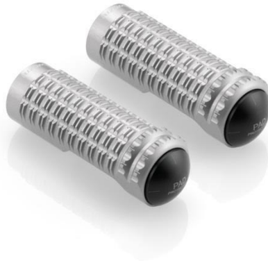
Austauschraste, Ausführung PE630