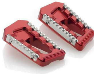
Austauschraste, Ausführung PE622