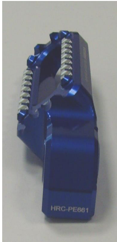
Austauschraste, Ausführung HRC PE661