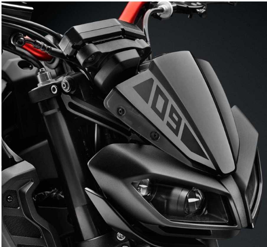
Windschild, Typ ZYF032