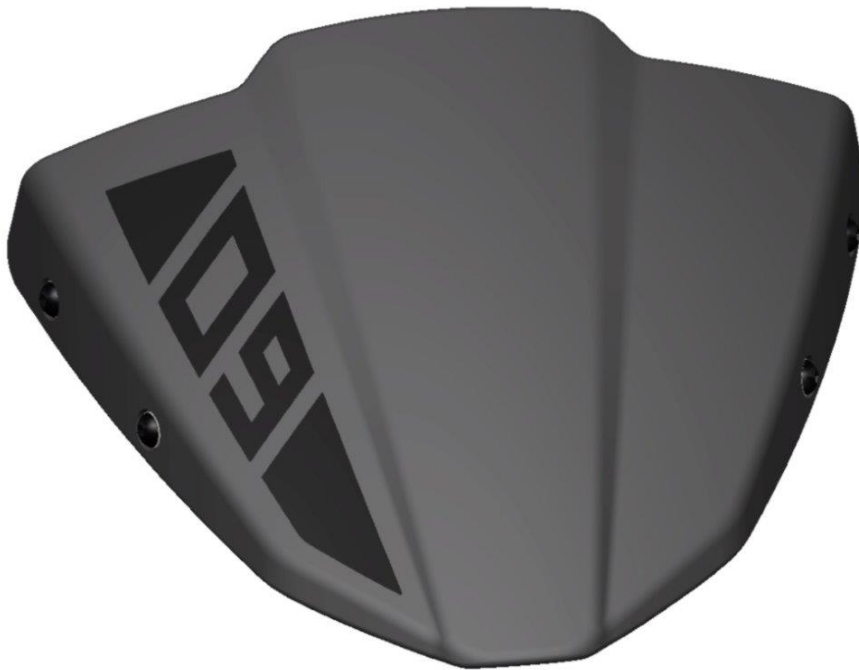
Windschild, Typ ZYF032